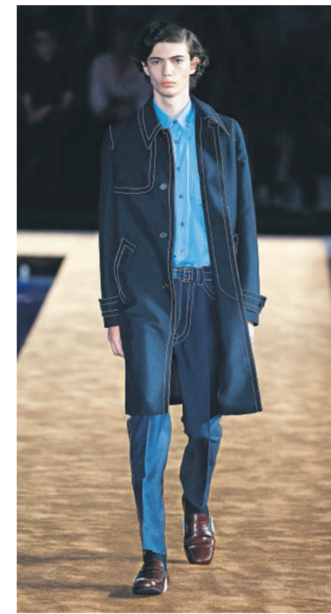
Van links naar rechts: mannenvoorjaarsmode voor 2015 in Milaan van Prada, Gucci en Bottega Veneta.

Zegna is niet het enige klassieke pakkenmerk dat in vorm was tijdens de mannenmodeweek in Milaan. Corneliani opende de modeweek met een ontspannen en zomere collectie in wit, beige en blauw, waar vooral de kraagloze overhemden en extra wijde broeken en leren anoraks en