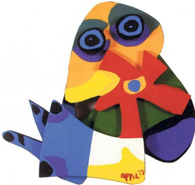
Karel Appel, 'Bloem met blauwe ogen' (1977)

'Als je de ontvangsthal van Van Rietschoten & Houwens aan de Sluisjesdijk in Rotterdam binnenkwam, viel je blik direct op een metersgroot schilderij van een labyrint. Een werk van de Britse kunstenaar Joe Tilson. Het bedrijf van mijn vader deed veel geheim werk voor onder andere de Nederlandse marine. Als mijn vader bezoekers ontving, begon hij de rondleiding altijd bij dit schilderij. "Het bedrijf is een labyrint en dat zal ik u de komende uren laten zien." Aan het einde van de rondleiding keerde hij met zijn gezelschap altijd terug bij dit werk. "Als u goed kijkt ziet u in het midden een paar ogen en een mond met een wijsvinger erop. Dat wil zeggen: mondje dicht over wat u zojuist allemaal hebt gezien".'