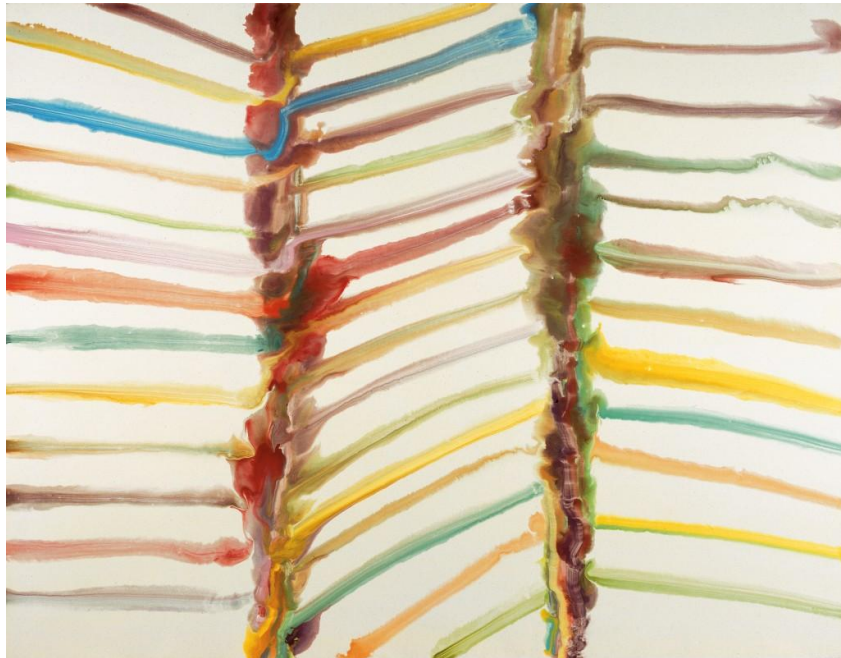
Bernard Frize, Apparition

'Culture of Colors' is een tentoonstelling die je ontvangt met open armen. Dat begint buiten al, waar Allard van Hoorns 7,5 meter hoge wand met bolvormige LED-lampjes op grote afstand zichtbaar is. Achter de open, glazen gevel lonkt meer: een piepschuimen sculptuur van Navid Nuur, modelstraaljagers van Ulrike Rehm, een explosie van kleurige bubbels op een schilderij van Seet van Hout.